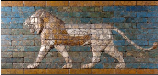
Mosaico Babilónico de la puerta de Istar 575 aC

Estos cuatro imperios comenzaron con Babilonia simbolizada como un león con alas de águilas (Daniel 7:4). Mientras que esta entidad había existido por más de 2000 años, su dominio mundial no comenzó hasta que el imperio asirio cayó ante los caldeos en 626 a.C. El reino de Babilonia finalmente llegó a su fin en 539 a.C. Cuando el medo-persa conquistó su capital ( Los Siete Grandes Monarquías del Antiguo Mundo Oriental , v.4, p. 526-527).