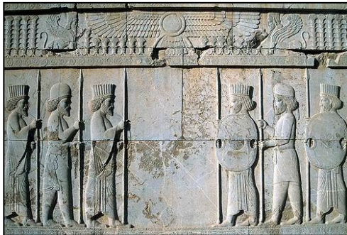
Un alivio relieve de soldados Medos y persas marchando juntos

La segunda bestia que Daniel vio, era el imperio Medo-persa simbolizado por un oso con tres costillas en su boca (Daniel 7:5). Las tres costillas representan Babilonia, Lidia y Egipto, naciones que este imperio conquistó. Medo-persa se mantuvo el gobierno supremo por más de 200 años (Durant, Historia de la Civilización , Vol. 1, Cap. XIII). Sucedió en ese tiempo que el Rey Ciro emitió un decreto para liberar a los judíos tomados cautivos por Nabucodonosor (Esdras 1). Más tarde, el rey Artajerjes, también conocido como Asuero, fue conocido por su casamiento con Ester y su relación comercial con la administración persa de Judá (Ester 2-10).