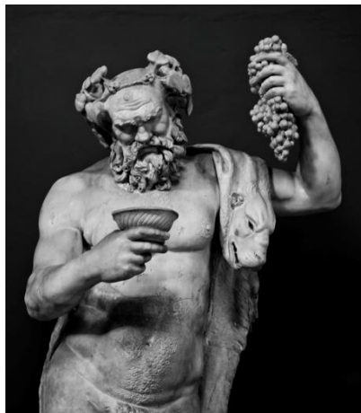
Estatua de Dionisio sosteniendo uvas y bebiendo vino