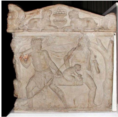
Sarcófago con el grabado del regreso de Dionisio (c. 101-200 d.C.)

En realidad, el bebé de año nuevo es mucho más viejo de lo que parece. En la antigua Grecia, era costumbre en el gran festival de Dión, pasear un bebé recostado en una canasta ventilada. Esto era hecho para simbolizar el renacimiento anual (o periódico) de ese dios como el espíritu de fertilidad. La ceremonia está presentada en un sarcófago que se encuentra ahora en Fitzwilliam en Cambridge, Inglaterra. Dos hombres, uno barbado, el otro en la flor de su juventud, son mostrados cargando a un infante en una canasta ventilada... (p. 67).