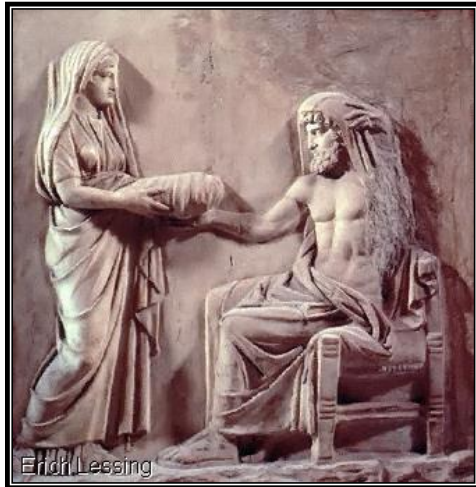
Relieve de Rea dándole a Cronos un bebé envuelto

Cronos fue el Titán gobernante quien llegó al poder al castrar a su padre Urano. Su esposa fue Rea, en tanto que sus descendientes fueron los primeros olímpicos. Para confirmar su seguridad, Cronos se comió a cada uno de sus hijos en cuanto nacían. Esto le funcionó hasta que Rea, infeliz por la pérdida de sus hijos, engañó a Cronos para que se tragara una roca en lugar de Zeus. Cuando este creció, Zeus se rebeló en contra de Cronos y los otros Titanes, vencéndolos y los desterró a Tártaros en el inframundo. Cronos logró escapar hacia Italia, donde él gobernó como Saturno. El tiempo de su gobierno, se dice que fue la época de oro de la tierra, honrada con la fiesta de la Saturnalia ( https://www.greekmythology.com/Titans/Cronus/cronus.html , retr. 10/23/2017).