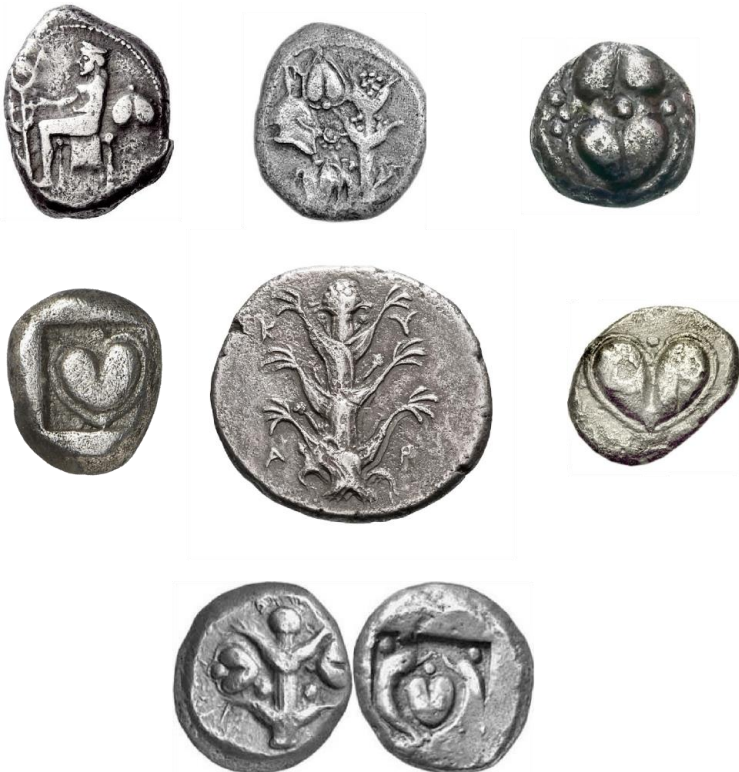
Monedas toscas de Cirene mostrando el Silfio y su fruto ca 510 -490 a.C.

El Silfio era grandemente apreciado como una planta alimenticia, así como medicinal. Era utilizada para combatir el resfriado común, malestar estomacal y muchos otros tratamientos. Sin embargo, su uso principal era como un ¡poderoso contraceptivo! La explicación para su gran valor es mejor entendido es como un medio para prevenir el embarazo. Aunque los antiguos sabían de otras plantas similares, tales como el té de Poleo, algunos de los tés y pociones hechos del Silfio se decía eran las formas más efectivas de control natal de esa época.